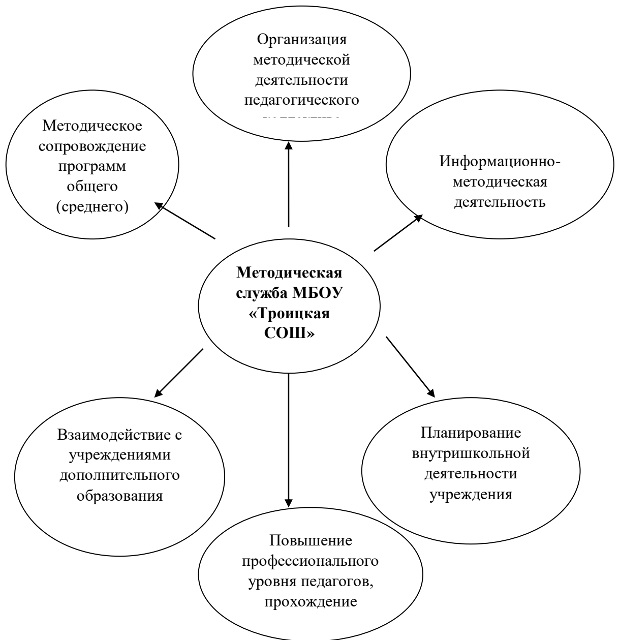
Схема системы методического обеспечения