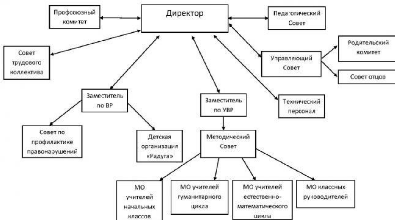
Структура и органы управления МБОУ «Троицкая средняя общеобразовательная школа»

Органы управления (персональные, коллегиальные), которыми представлена управленческая система ОУ;